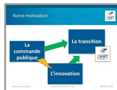
PowerPoint Pierre Lachaize