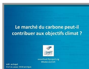
Vidéo Frédéric Dinguirard