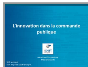
Vidéo Pierre Lachaize